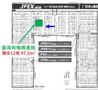
圖 1、JFEX 2024 臺灣有機農產館預定位置