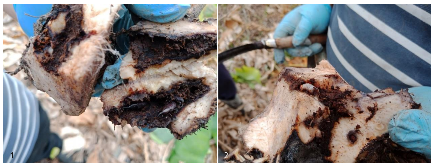
1、2利用0.5%可尼丁粒劑防治香蕉象鼻蟲類害蟲農藥田間藥效藥害試驗。

象鼻蟲類害蟲中的假莖象鼻蟲剩下加保扶(IRAC 1A)與三落松(IRAC 1B)，球莖象鼻蟲剩下加保扶(IRAC 1A)與托福松(IRAC 1B)可以使用，在輸日香蕉病蟲草害防治用農藥參考基準表單中，加保扶與三落松屬於日本殘留容許量較我國嚴苛者，兩者應要盡量避免使用，如此一來，陶斯松的禁用將會導致種植外銷香蕉的農友沒有藥劑或藥劑選擇性很少的景況發生。為補充香蕉象鼻蟲類害蟲田間防治之藥劑缺口，本所以藥劑0.5%可尼丁(Clothianidin)粒劑(GR) (IRAC 4A) 進行防治效果評估，訂定推薦用量：每公頃每次用量81-90公斤(45公克/株)，使用時期：苗期施藥一次，將藥劑均勻施用於莖基周圍15公分處，覆土後灌水，保持適當濕度，依使用方法用藥，無需訂定安全採收期。