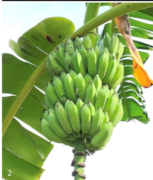
1、2 南華蕉果實樣態。 3台式爆炒南華蕉花苞料理。 4東南亞炭火串燒及外沾麵粉油炸南華蕉果實料理。